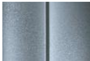
Серебристый (Gris Aluminium)