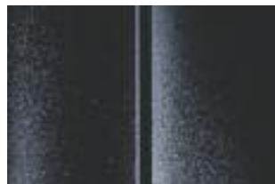
Черный (Noir Perla Nera)