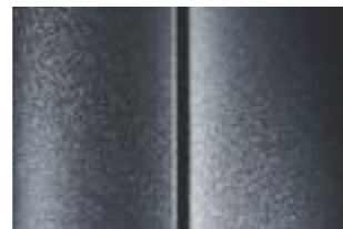
Серый (Gris Shark)