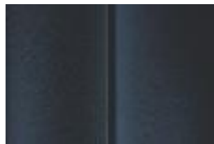
Темно-синий (Bleu Bourrasque)