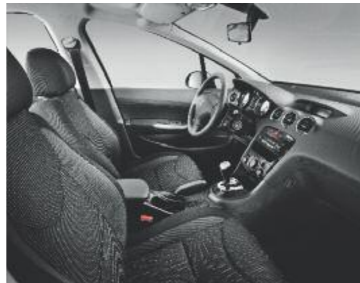
Allure – Strada с декорацией Sofis