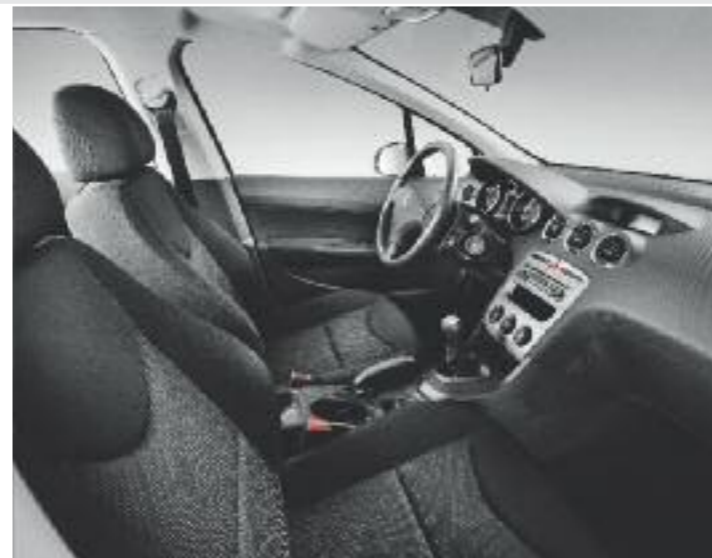
Access – Mistral Sibyak