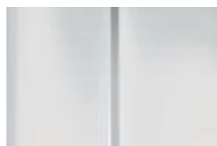
Белый (Blanc Banquise)