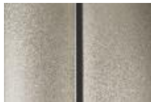
Бежевый (Beige Mativoire)