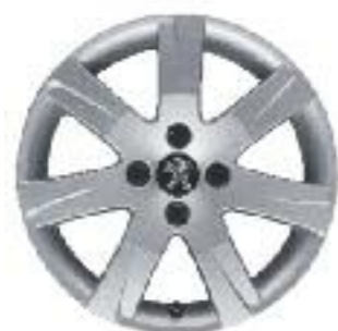
легкосплавные диски Santiagito 2 16" (Allure)