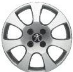
стальные диски с декоративными колпаками Toliman 16" (Access, Active)