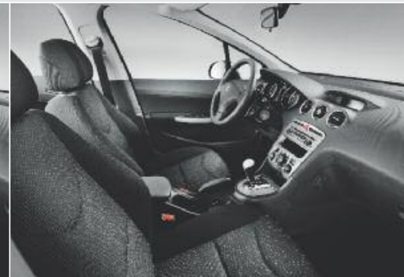
Active – Chilico Sibyak